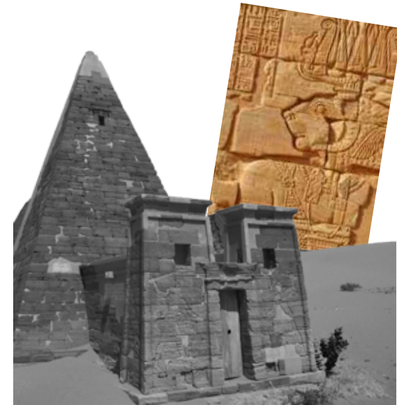
Création ADEC M. Frère juin 2016 - Pyramide de Méroé et dieu Apedemak © Nicole Lurati