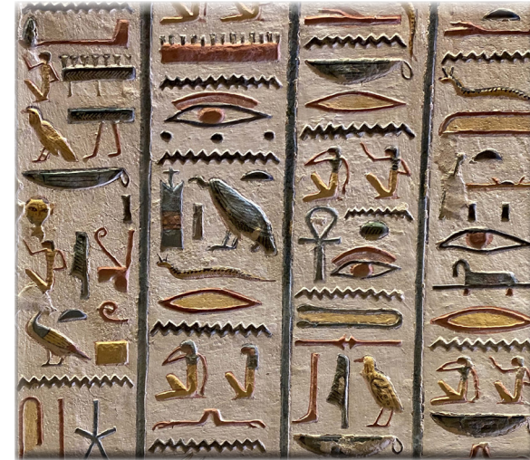
Création ADEC Mathilde FRÈRE mai 2022 | Paroi de la tombe de Ramsès IX

HISTOIRES D'UN DÉCHIFFREMENT HIÉROGLYPHES