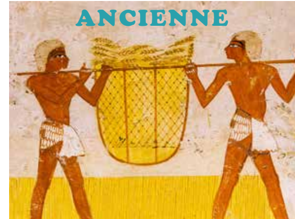
Création ADEC M. Frère mai 2017 - Tombe de Menna (TT 69)